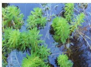
Robinier faux-acacia ( Robinia pseudoacacia )