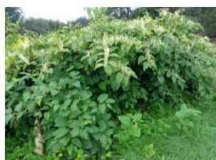
Renouée du Japon ( Reynoutria japonica )