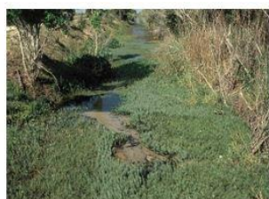
Séneçon en arbre ( Baccharis halimifolia )