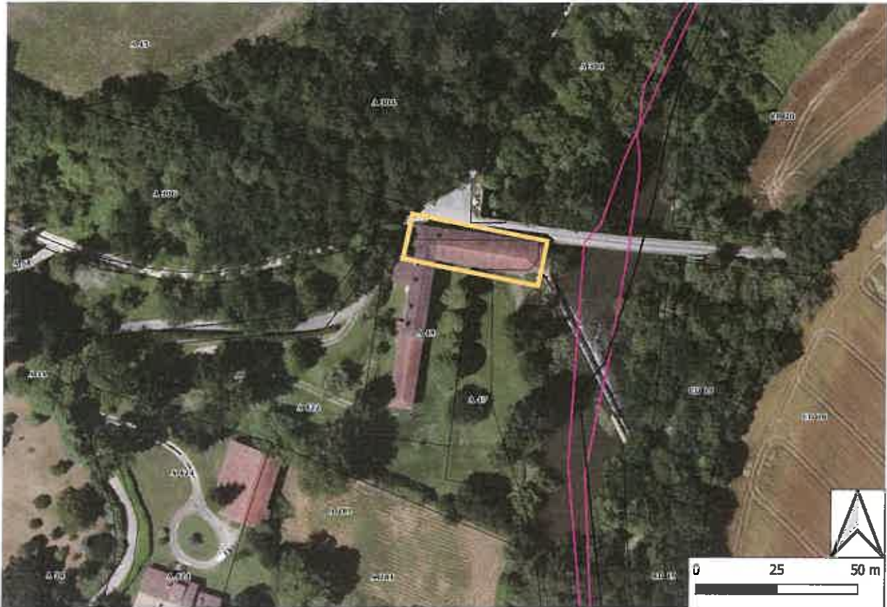
Carte 1 : Localisation des zones prise en compte dans la convention